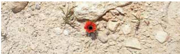
«Signs of Hope» - en blomst i tørr jord ved Tantur, Betlehem