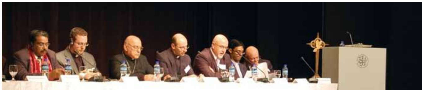
Fra lanseringen av det palestinske Kairos-dokumentet i Betlehem, 11.desember2010