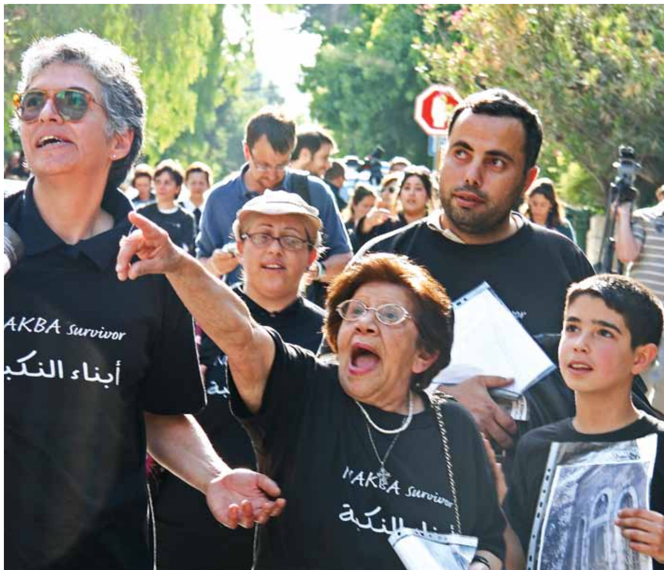
Palestinere markerer Nakba (katastrofen) ved 60årsmarkeringen i mai 2008