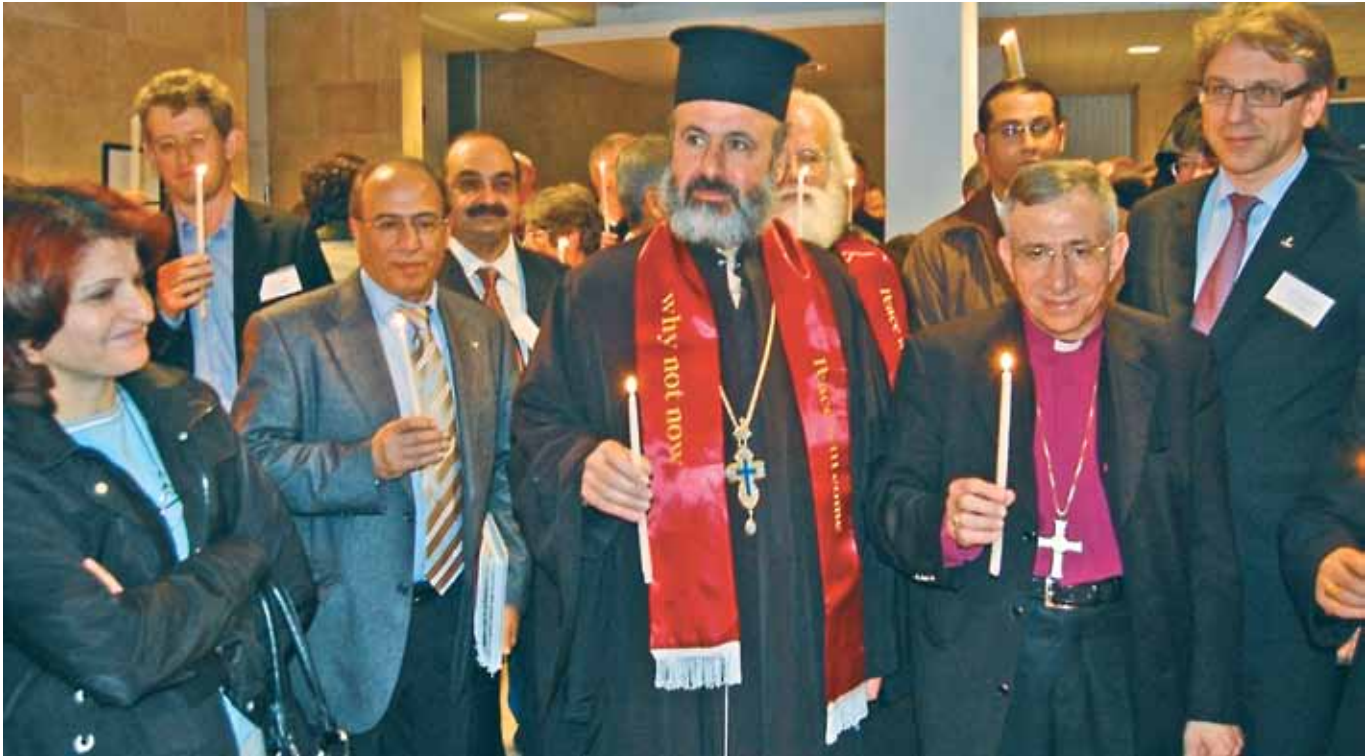
Lystening ved lanseringen av dokumentet Kairos Palestina 11. desember 2009